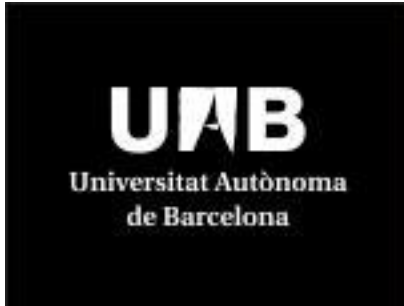
Universidad Autónoma de Barcelona, España.